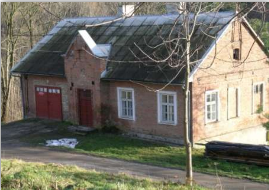
Stara szkoła w Bliziance – obecnie OSP w Bliziance